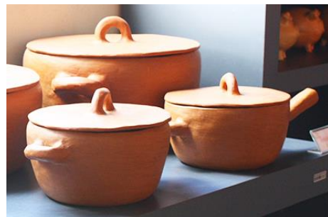
Figura 8. Panela de fundo plano do artesão Abrão para fogão à gás (2017) Casa do Artesão, Apiaí

Essa troca entre artesãos e consumidores faz parte da atividade cerâmica. Ambos atuam no desenvolvimento de produtos ajustando os objetos às necessidades temporais e culturais nas diversas situações de uso que se modificam.