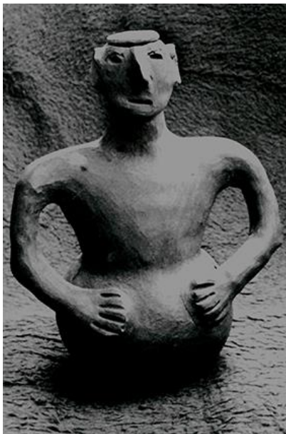
Figura 5. Boneca da artesã Florinda Dias Batista Catálogo da exposição: Cerâmica de Apiaí Paço das Artes, São Paulo 1979

Essas esculturas eram os principais objetos das exposições sobre a cerâmica do Vale (Figuras 5 e 6), hoje são raramente encontradas para o comércio, a maioria das artesãs que produziam esse tipo de objeto faleceu ou não trabalha mais e a preferência atual não inclui esses objetos enigmáticos.