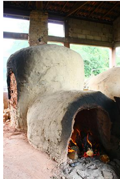
Figura 2. Forno da Associação dos Artesãos, Polo Arte nas Mãos (2017) Encapoeirado, Apiaí

Se por um lado a tradição dos fornos de barranco se perdeu, por outro construiu-se um novo conhecimento de fazer comunitário, e ao que pude verificar, esses espaços distanciam as artesãs de suas moradias propiciando uma atividade menos informal.