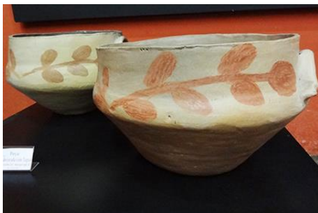
Figura 7. Panela de fundo côncavo da artesã Custódia para fogão à lenha (1980) Casa do Artesão, Apiaí

Outros utilitários se adaptaram para atender às necessidades atuais, por exemplo as panelas de fundo côncavo que se encaixavam perfeitamente nas bocas dos fogões à lenha (Figura 7), hoje possuem o fundo plano, muito mais eficaz para o fogão à gás (Figura 8).